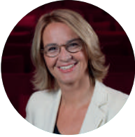
Sonja Hasler Moderatorin SRF

Sonja Hasler ist Theologin und Moderatorin beim Schweizer Radio und Fernsehen SRF. Sie moderierte das Politmagazin «Rundschau», die «Arena» und bis vor Kurzem die Radio-Talk-Sendung «Persönlich». Heute ist sie Produzentin der Frühsendung bei Radio SRF 1 und arbeitet als freie Moderatorin.